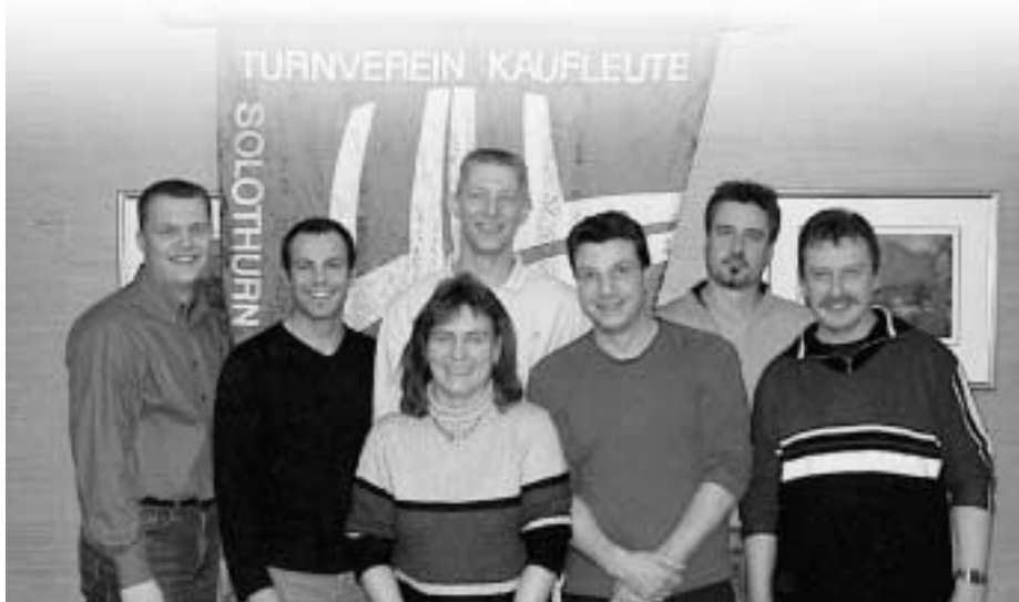
Der neue Vorstand der Aktivriege.