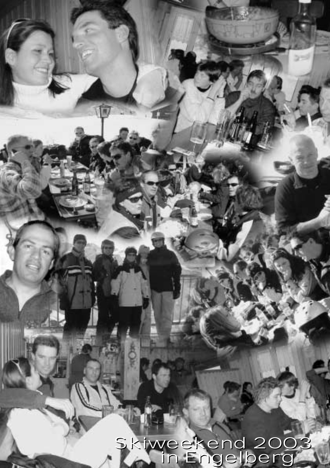
Skiweekend 2003 in Engelberg