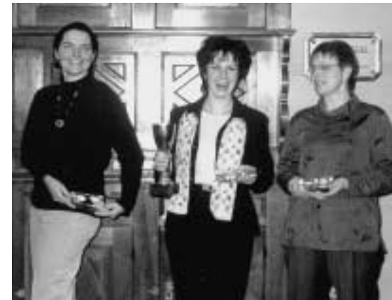
Die Siegerinnen der Vereinsmeisterschaft 2002.