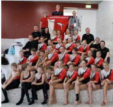
Schaukelring Jugend 1. Rang an den Schweizermeisterschaften in Vaduz