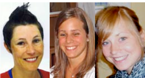
Ti KD Jane TI K7 Miggi Bine (Ersatz)