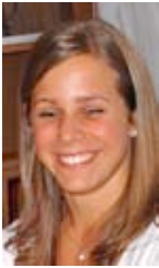
Michela Bisig Media