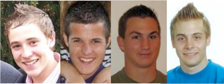
TU K5 Jünu Jänu Rambo Tim